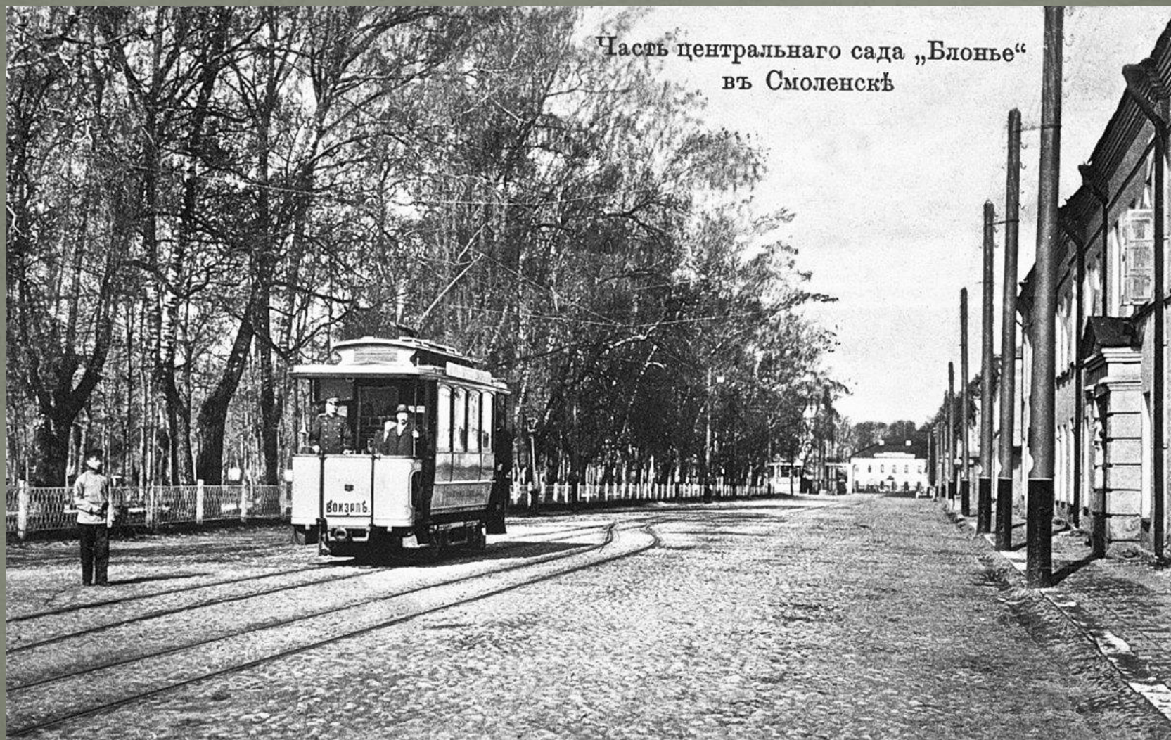
Часть центрального сада „Блонье“ въ Смоленскѣ