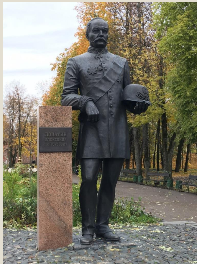
Памятник А. Г. Лопатину

Одно из самых красивых и романтических мест Смоленска - это Лопатинский сад. Он был создан в 1873 году по указу губернатора А. Г. Лопатина на территории обветшавшего к тому времени Королевского бастиона. В советское время он был увеличен, но, увы, различные палатки и аттракционы нарушили первоначальную гармонию сада, некогда считавшегося одним из самых красивых в России.