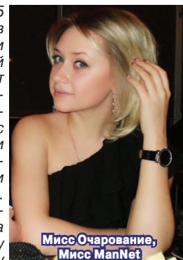
Мисс Очарование, Мисс ManNet

Родилась 15 февраля 1992 года в Смоленской области в городе воинской славы Ельня. С 6 лет выступала в хореографическом коллективе «Юность», с которым объездила всю Смоленскую область и выигрывала различные призы. Занималась танцами 11 лет. Закончила музыкальную школу имени М. И. Глинки у себя в городе с отличием. Училась 11 классов в Ельнинской школе №2, которую закончила с серебряной медалью в 2009 году. В этом же году поступила в СФ МЭИ на специальность «Прикладная информатика в экономике» на бюджетной основе, где и учусь на сегодняшний день. Сейчас являюсь студенткой 4 курса.