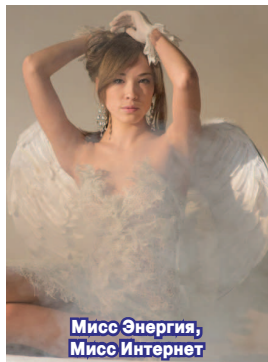
Мисс Энергия, Мисс Интернет

Родилась 15 сентября 1991 года в г. Духовщина. С 8 лет занималась тхэквондо, была на многих соревнованиях в разных городах, всегда была в тройке победителей. С 8 класса обучалась в педагогическом лицее им. Кирилла и Мефодия на физико-математическом профиле. Затем поступила в СФ МЭИ на специальность «Промышленная электроника» на бюджетной основе, где и обучается по сей день на четвертом курсе. Воплотила свою детскую мечту - научилась танцевать.